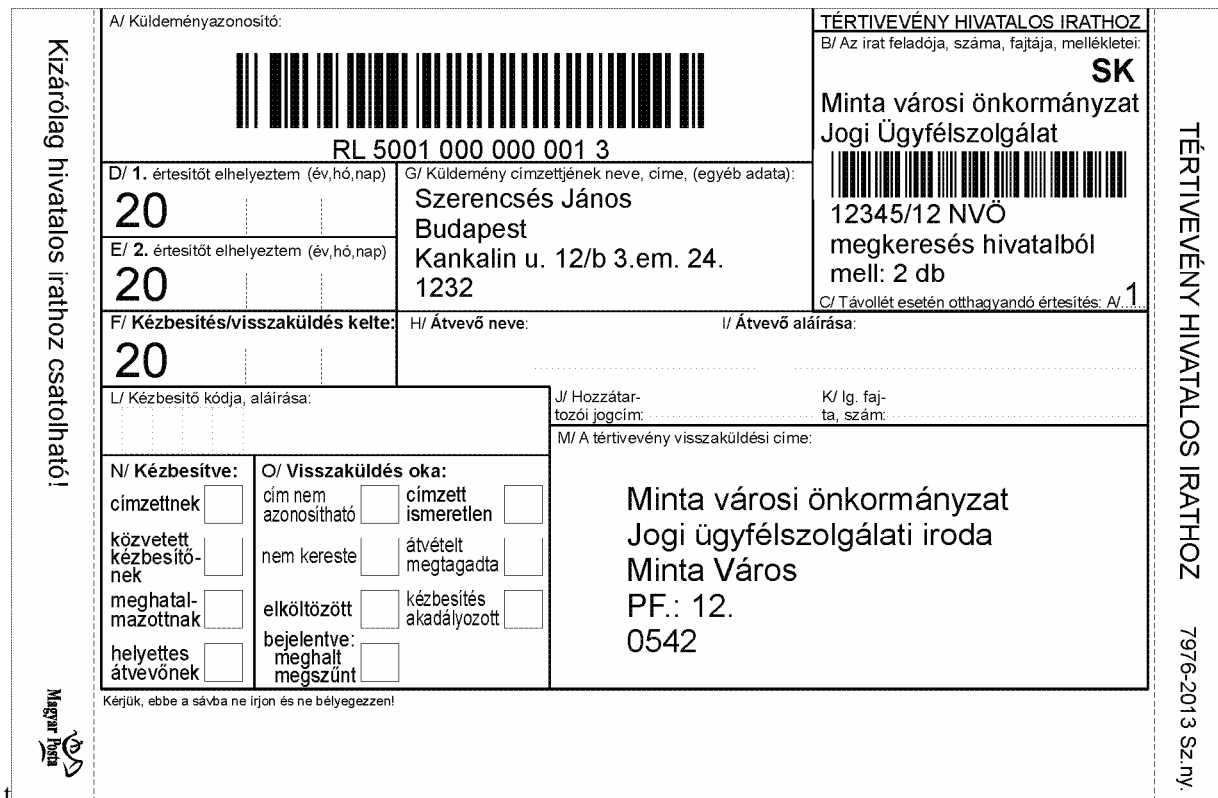
6. sz. ábra: A tértivevény előoldala –minta2. nem méretarányos

Az alábbi mintán (6. sz. ábra – minta2.) a saját kézbe többlétszolgáltatás feltüntetésére ajánljuk a B/ mezőben elhelyezett SK feliratot.