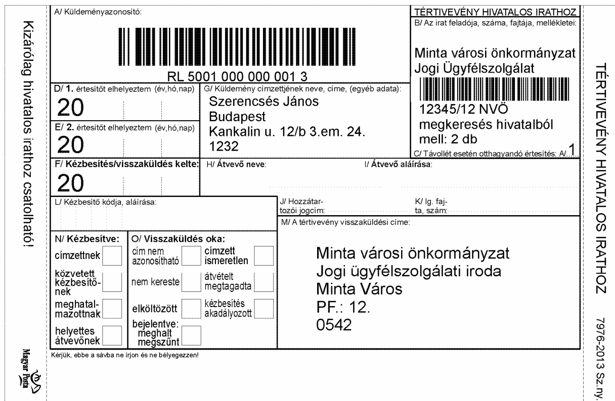
5. sz. ábra: A tértivevény előoldala –minta1. nem méretarányos

Az alábbi minta (5. sz. ábra – minta1.) a kétféle címzésminta (címhelyi kézbesítés – G/ mezőben - és postafiókra történő kézbesítés – M/ mezőben -) előírásait is szemlélteti.